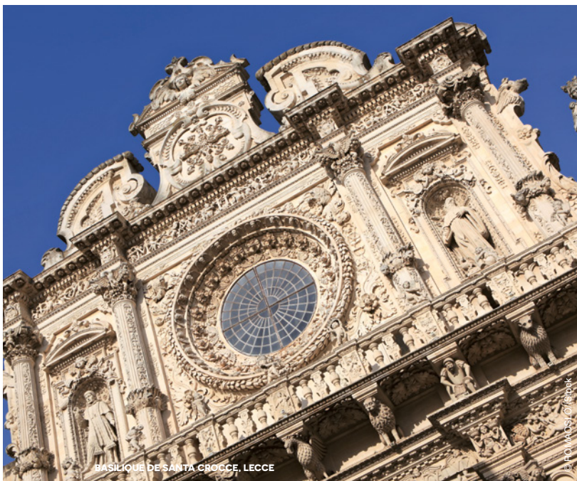
BASILIQUE DE SANTA CROCE, LECCE