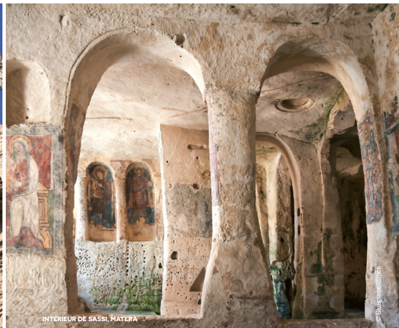
INTÉRIEUR DE SASSI, MATERA